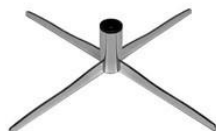
4BCCH 4-Stern Fuß gewellt Chrom hochglanz