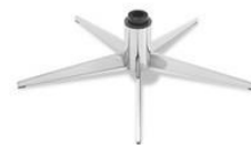
5B-CH 5-Stern Fuß Chrom hochglanz