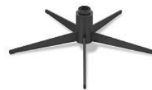
5B-LB 5-Stern Fuß lackiert