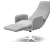
3870-MU-MI Relaxsessel multi-move mini W 69 D 88/163 H 111 SH 47 SD 53