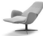
7790-MI Relaxsessel mono-move mini W 69 D 85/157 H 111 SH 45 SD 47